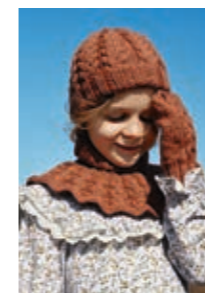
FLETTE TILBEHØR Smart Design 5