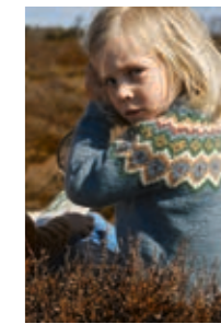
ALEX Smart Design 4