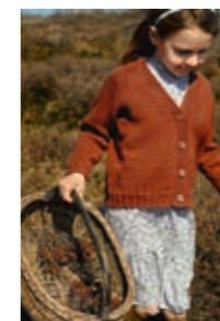
V-NECK CARDI Smart Design 7