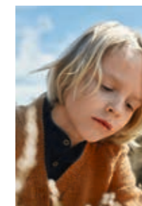
V-NECK CARDI Smart Design 7