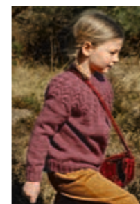
FLETTEGENSER Smart Design 6