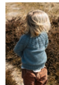
FLETTEGENSER Smart Design 6