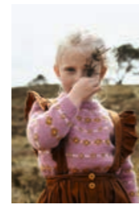
LUCA Smart Design 2