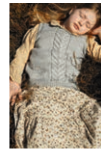
VILJEVEST Smart Design 3