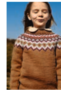
ALEX Smart Design 4