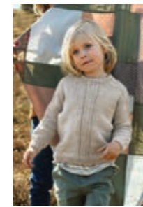
SANDERGENSER Smart Design 1