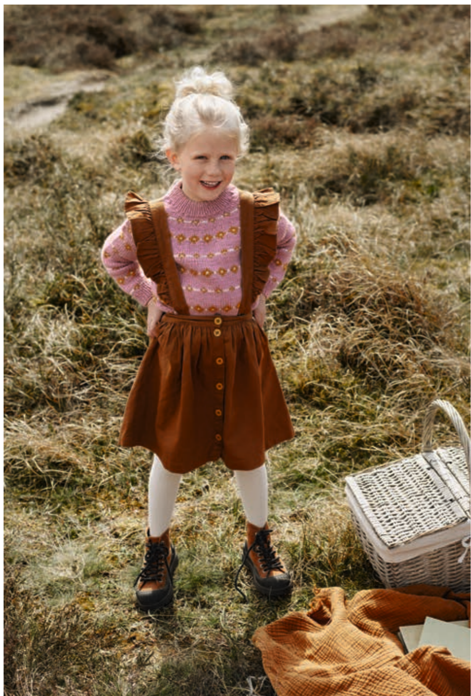
2009 | SMART | X 4 | 20110 | •• LUCA | 2-12 ÅR (ovenfra og ned)