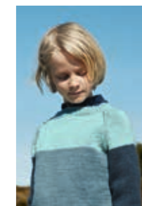
COLOURBLOCK Smart Design 8

EVENTUELLE RETTELSE TIL DETTE HEFTET FINNER DU PÅ SANDNESGARN.NO